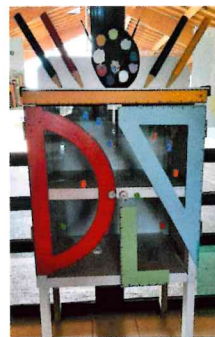
Une deuxième boîte à livres a vu le jour à l'école.

- Boîte à livres : installée sur le mur de la mairie face à la poste et réalisée par les mains expertes d'un de nos élus, elle permet de déposer ou d'emprunter un livre qui sera ramené après lecture.