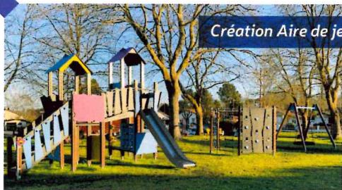
Création Aire de jeux

- L'accueil de loisirs connaît toujours le même succès avec 1242 journées de fréquentation, grâce